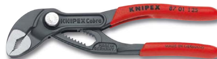
87 01 125 Рисунок 1:1