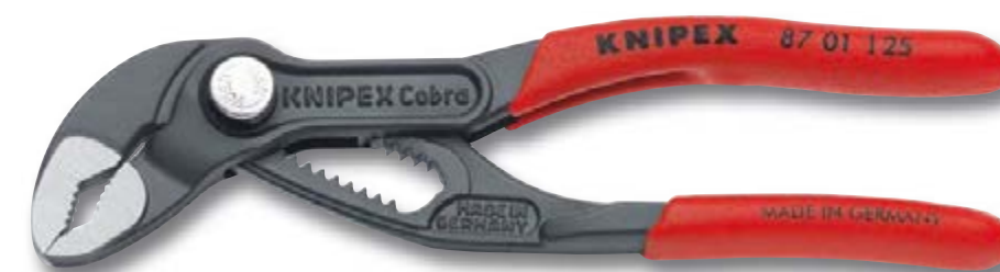
87 01 125 Рисунок 1:1