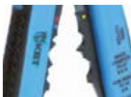
Модуль для опрессовки WS-07

Предназначен для опрессовки втулочных наконечников типа НШВ, НШВИ сечением от 0.5 до 6.0 мм 2