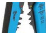
Модуль для опрессовки WS-04A

Возвратные пружины (2шт.) служат для возврата прижимных губок и рукояток в исходное положение