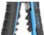
Модуль для опрессовки WS-11

Предназначен для опрессовки изолированных гильз и наконечников сечением от 0,5 до 6 мм 2 (НКИ, НИК, НВИ, ГСИ, НШКИ, НШПИ, изолированных разъемов), а так же неизолированных гильз и наконечников, в том числе и автоклемм