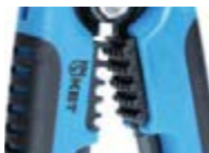
Модуль для опрессовки WS-04B

Предназначен для опрессовки изолированных гильз и наконечников сечением от 0,5 до 6 мм 2 (НКИ, НИК, НВИ, ГСИ, НШКИ, НШПИ, изолированных разъемов) и неизолированных гильз и наконечников сечением от 0,5 до 6 мм 2 (ГМЛ, ГМЛ(о), ТМ, ТМЛ, ТМЛ(о), автоклемм)