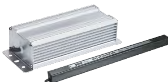
Драйверы IP67 влагозащищенные в алюминиевом корпусе (DC 12В)