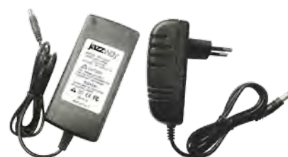
Адаптеры 12В (12W, 24W, 36W, 48W)