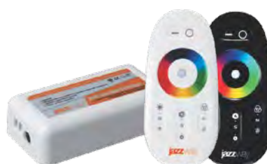
Контроллер RGB 4000HF