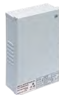
Драйвер IP45 брызгозащищенный (DC 12В)