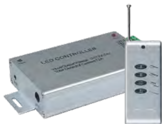
Контроллер RGB 2000RC