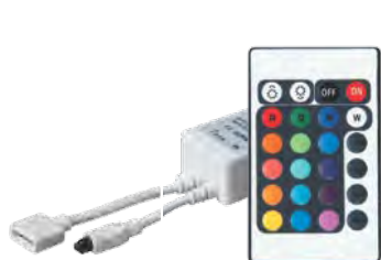
Контроллер RGB 1000RC

Тип управляющего сигнала отличается у разных моделей контроллеров jazzway : инфракрасный, радиочастотный, высокочастотный.