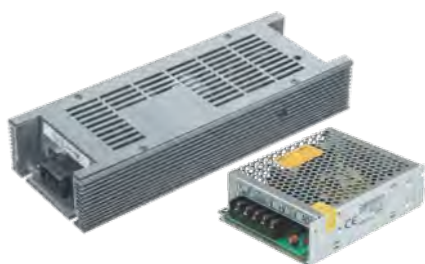
Драйверы IP20 (DC 12В)

Блоки питания для светодиодов различных мощностей могут быть герметичные или негерметичные, с защитой от перенапряжения, с корректировкой мощности, что существенно увеличивает срок службы светодиодных изделий. Номинальное выходное напряжение блоков питания – 12 В.