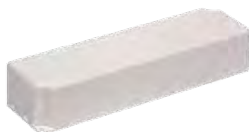
Драйвер IP67 влагозащищенный в пластиковом корпусе (DC 12В)