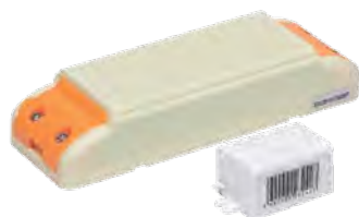
Драйверы IP20 в пластиковом корпусе (DC 12В)