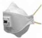
Фильтрующая противоаэрозольная полумаска 9312+