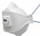
Фильтрующая противоаэрозольная полумаска 9322+