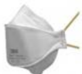
Фильтрующая противоаэрозольная полумаска 9310+