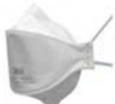
Фильтрующая противоаэрозольная полумаска 9320+