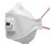
Фильтрующая противоаэрозольная полумаска 9332+