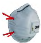
3M™ Противоаэрозольная Фильтрующая Полумаска 8132