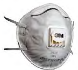
3M™ Противоаэрозольная Фильтрующая Полумаска 8112