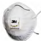
3M™ Противоаэрозольная Фильтрующая Полумаска 8122